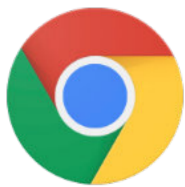
Google Chrome wersja 55 i nowsze