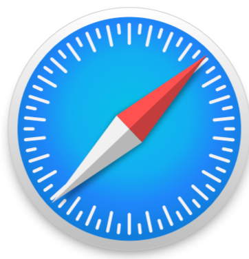
Safari wersja 11 i nowsze